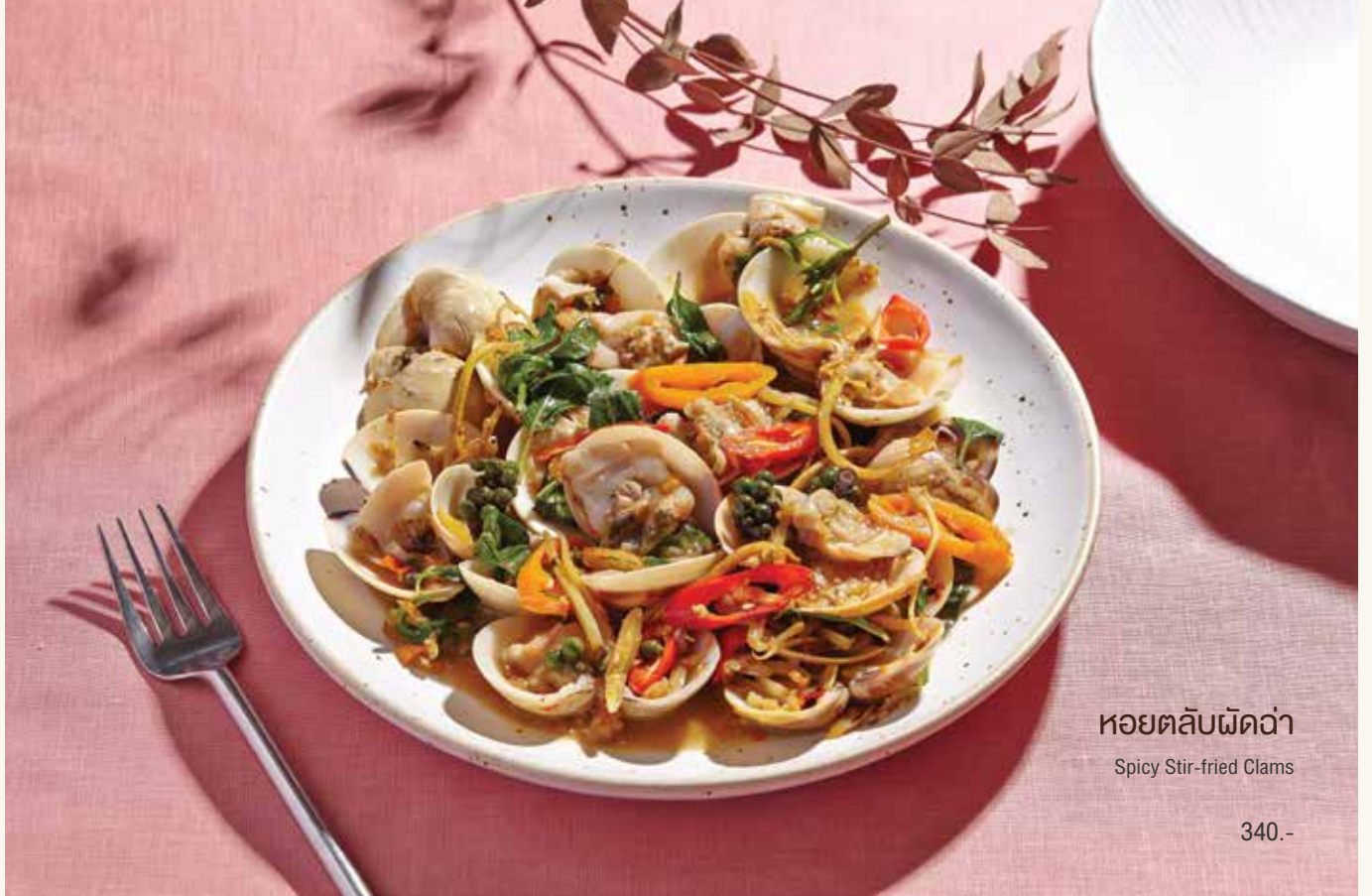
หอยตลับผัดฉ่า Spicy Stir-fried Clams