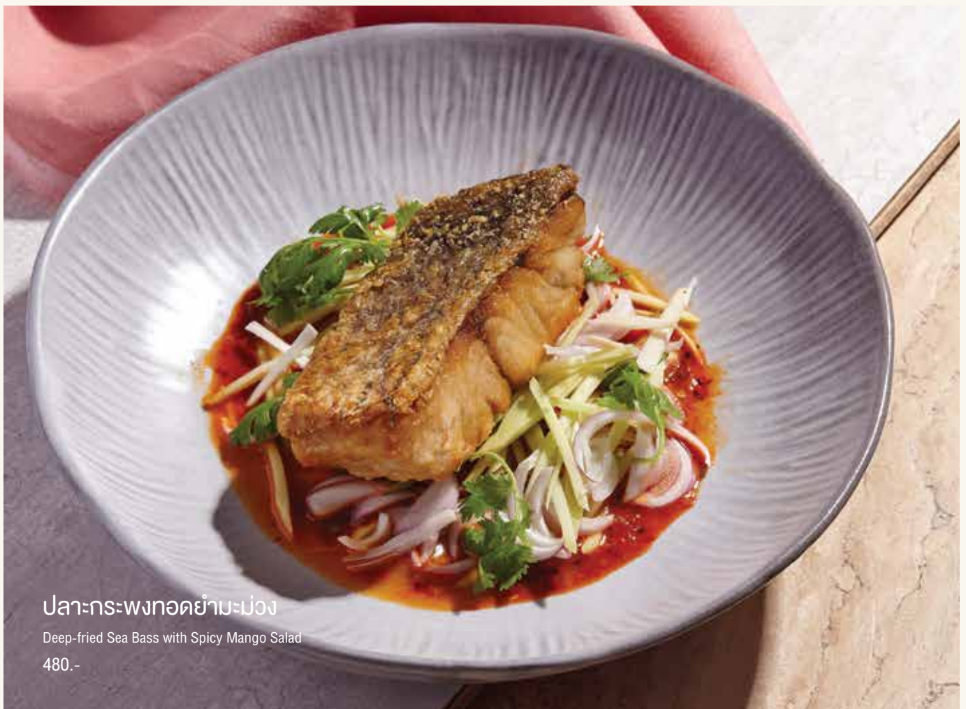
ปลากระพงทอดยำมะม่วง Deep-fried Sea Bass with Spicy Mango Salad 480.-